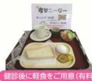
健診後に軽食をご用意(有料)