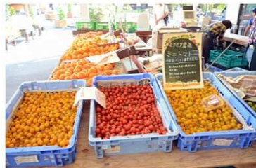
いろいろな種類のプチトマト