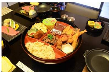
ジャンボおな子様ランチ