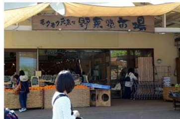
もくもく、元気な野菜塾市場