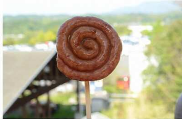
もくもく名物くるくるソーセージ