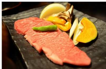
近江牛ステーキ御膳