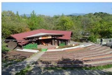
ミニブタステージ

バス旅行の目玉はグルメと楽しさ、昼食会場の「魚松」はお子様ランチの大きさにまずビックリ、自分で焼くステーキも豪華な雰囲気、しかも松茸の土瓶蒸しまで付いてきます。おみやげも充実、あいの土山は地元の農産品、もくもくファームは野菜、パン、食肉と何でもそろふ品数充実。子ぶたレースや乗馬体験などお楽しみもいっぱいあります。