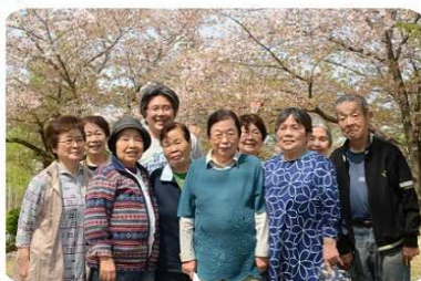
4月4日(水)お花見昼食会