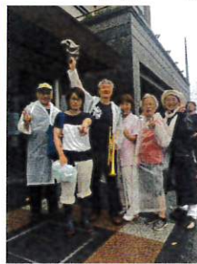
区役所前で行進参加者

2020年までに、「ヒバクシヤ国際署名」は世界教団をめざします。核保有国や日本政府を禁止条約に参加させるには世界の世論と運動が力かぎをにぎっています。私たちの草の根の運動、被爆者の証言などを力に変え、「ヒバクシヤ国際署名」が決定的に重要です。