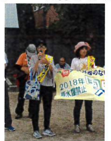
フィリピンから通し行進に

核兵器禁止条約は、現在59カ国が調印し、10カ国が批准しました。発効の条件は50カ国です。