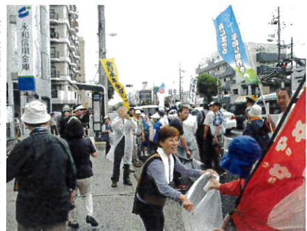
診療所前で平和行進給水支援の取り組み

8月4日から6日、広島で原水爆禁止2018年世界大会が広島で開催されます。国連で核兵器禁止条約採択でいっそう重要な大会として注目されます。