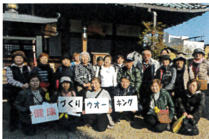
閻魔大王で有名な長宝時にて

「今日初めて歩き、いろんな歴史を知りました」「大念仏寺は2回目、1回目は18歳ここで結婚式をあげたとき、その夫も9月に亡くなりました、参加できうれいです」「杭全社や大念仏寺の楠木のたくましさ、戦