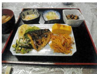
2/20 焼き鯖、パスタ昼食

次回配食日 4月17日(水) 生協会館12時～ ボランティアさん募集中 配食、食事会ご希望の方は下記まで 070-5023-6367 吉野