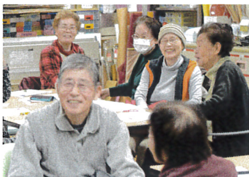
楽しい講義に笑顔いっぱい参加者さん