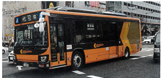
試験運転中のいまざとライナー、4/1から生野の街を本格走行