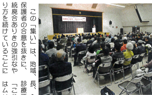
夜にもかかわらず詰めかけた参加者

3月14日、生協会館で「笑いヨガ」が行われ、初参加7名を含む16名が参加しました。 笑いヨガは「笑い」の体操と「ヨガ」の呼吸方法を組み合わせ合わせた運動法です。笑いには、健康に良く、人間関係を豊かなる効果があります。 「あぶり、カルピ」「あぶりカルピ」と3回、続けて言いながら隣の方に声をかけていきなり、1分間声を出して笑ったり、1分間声を出さないで笑ったり、右隣、左隣、正面の方と笑いながら挨拶したり、続けていくと、ほとんど身体が温まって、みんなが親しくなっていく。 「笑いヨガ」の体操と「ヨガ」の呼吸方法を組み合わせ合わせた運動法です。笑いには、健康に良く、人間関係を豊かなる効果があります。 「あぶり、カルピ」「あぶりカルピ」と3回、続けて言いながら隣の方に声をかけていきなり、1分間声を出して笑ったり、1分間声を出さないで笑ったり、右隣、左隣、正面の方と笑いながら挨拶したり、続けていくと、ほとんど身体が温まって、みんなが親しくなっていく。