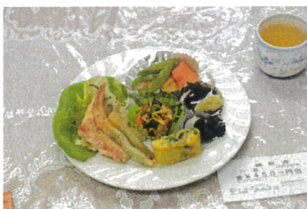
3/20 天ぷら盛り合わせ定食