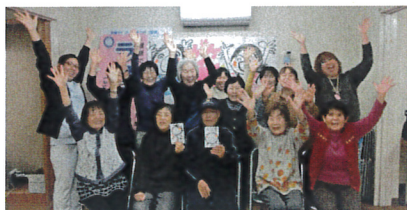
参加者そろっての大笑い

3月14日、生協会館で「笑いヨガ」が行われ、初参加7名を含む16名が参加しました。 笑いヨガは「笑い」の体操と「ヨガ」の呼吸方法を組み合わせ合わせた運動法です。笑いには、健康に良く、人間関係を豊かなる効果があります。 「あぶり、カルピ」「あぶりカルピ」と3回、続けて言いながら隣の方に声をかけていきなり、1分間声を出して笑ったり、1分間声を出さないで笑ったり、右隣、左隣、正面の方と笑いながら挨拶したり、続けていくと、ほとんど身体が温まって、みんなが親しくなっていく。 「笑いヨガ」の体操と「ヨガ」の呼吸方法を組み合わせ合わせた運動法です。笑いには、健康に良く、人間関係を豊かなる効果があります。 「あぶり、カルピ」「あぶりカルピ」と3回、続けて言いながら隣の方に声をかけていきなり、1分間声を出して笑ったり、1分間声を出さないで笑ったり、右隣、左隣、正面の方と笑いながら挨拶したり、続けていくと、ほとんど身体が温まって、みんなが親しくなっていく。