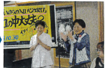
10月30日お口の健康教室 27名 食べ続けられる大切さとそれを守るための磨き方の勉強、歯間フロスの使い方を学びました。