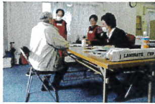
10月27日出張健診 12名 田島診療所初めての出張健診は生野東住宅集会所で西1支部と共同開催、目標の10名を超え大成功