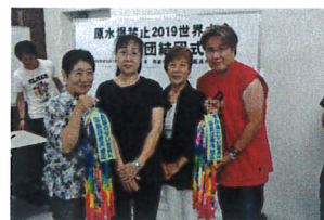
結団式で千羽鶴の願いを託す

ことを知り、もっと学習しなければの思いで参加です。「福島原発事故のあと、国の政策により被災者が分断され、対立や格差がつけられていく」「原爆被害も原発被害もまだ終わっていない、しらないことを学びたい参加です。