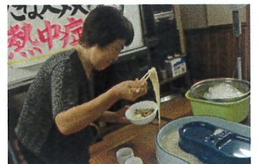
くるくる回る流しそうめん器