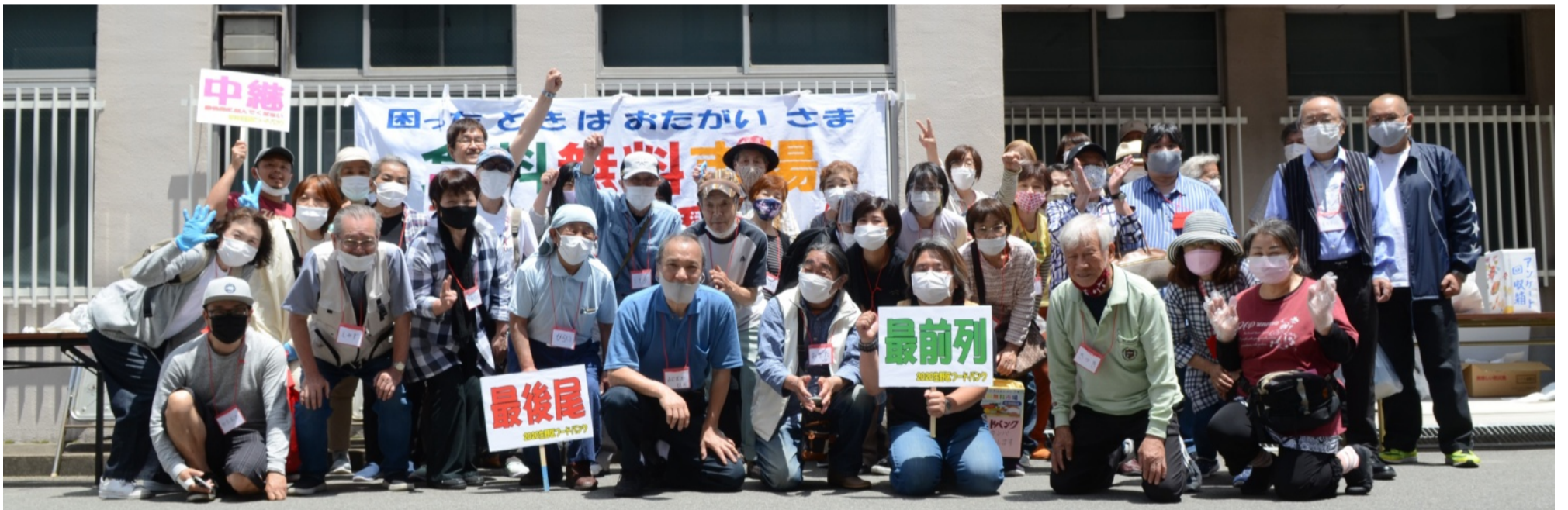
ボランティア総勢50名、ヘルスコープおおさかの他、新婦人、民商、関中協、平和委員会、府高教、地域の方など多士多才