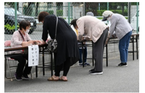
今後のためにアンケートをお願いします