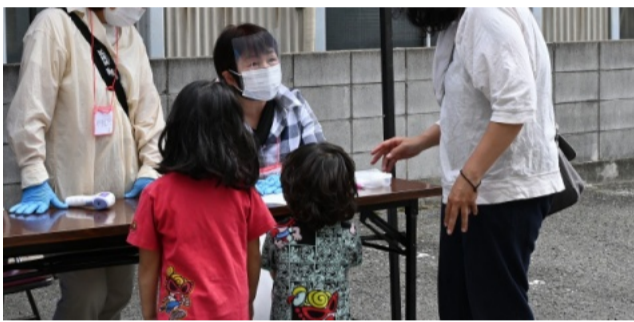
相談コーナーもあります、よろしければどうぞ

6月6日、生野フードバンク開催、 205名に食料品基本セットを手渡し ボランティア50名が成功に向け奮闘