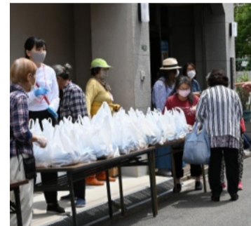
重いから気を付けてくださいね