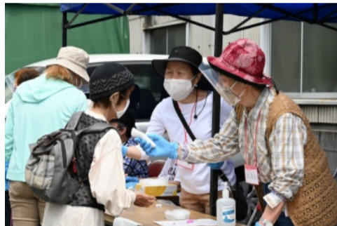
検温させていただきますね