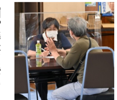
弁護士さんが参加しての相談

「困った時はおたがいさま」の気持ちで、「口子禍で生活苦に直面している方々へ地域の方から提供された食料や日用品を届けよう」と、6月6日、生野民商をお借りして、「食料無料市場」(フードバンク)を開催しました。